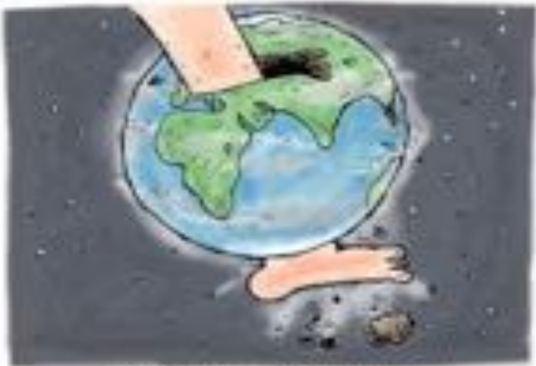
Man's footprint on the planet today