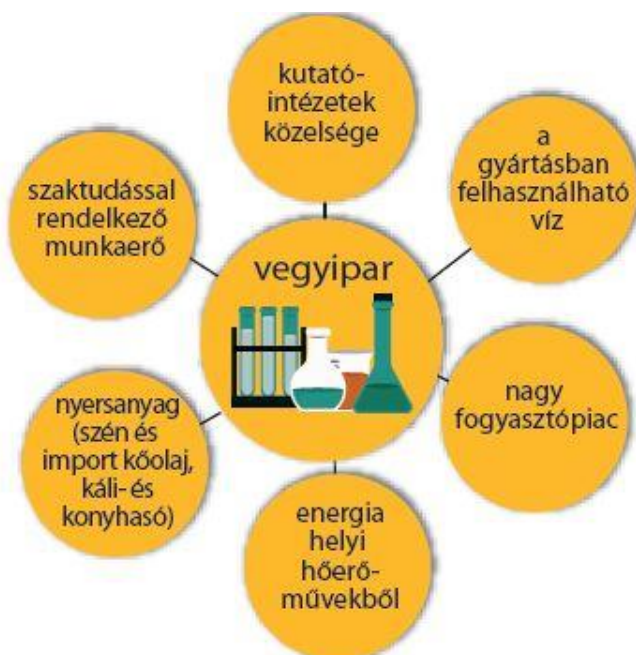
6.11. ábra. A vegyipar telepítő tényezői