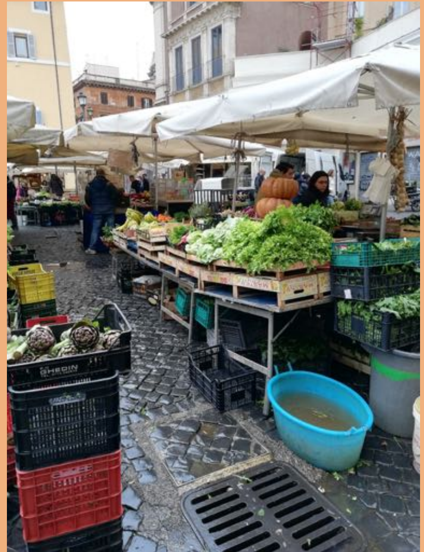
Római piac február végén