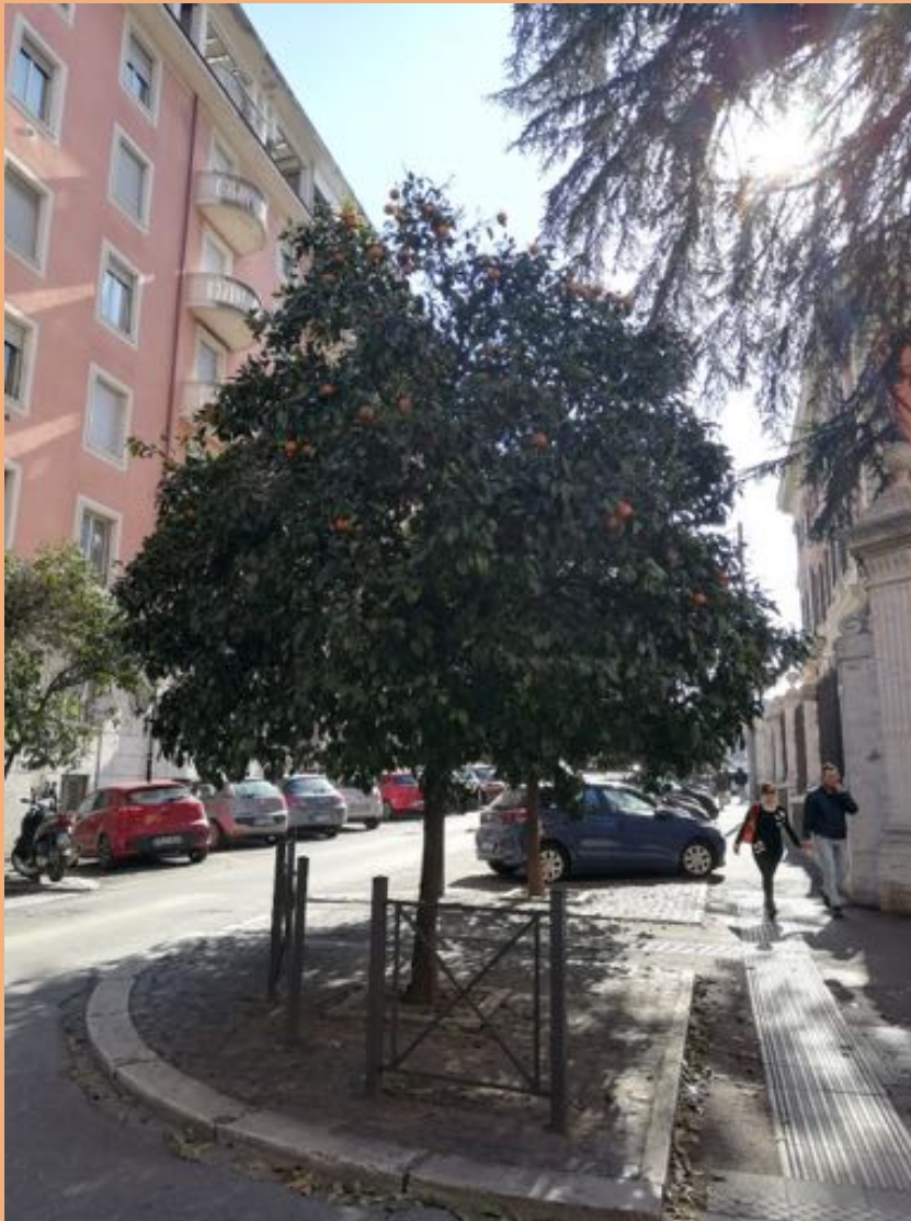
Narancsfa Róma belvárosában