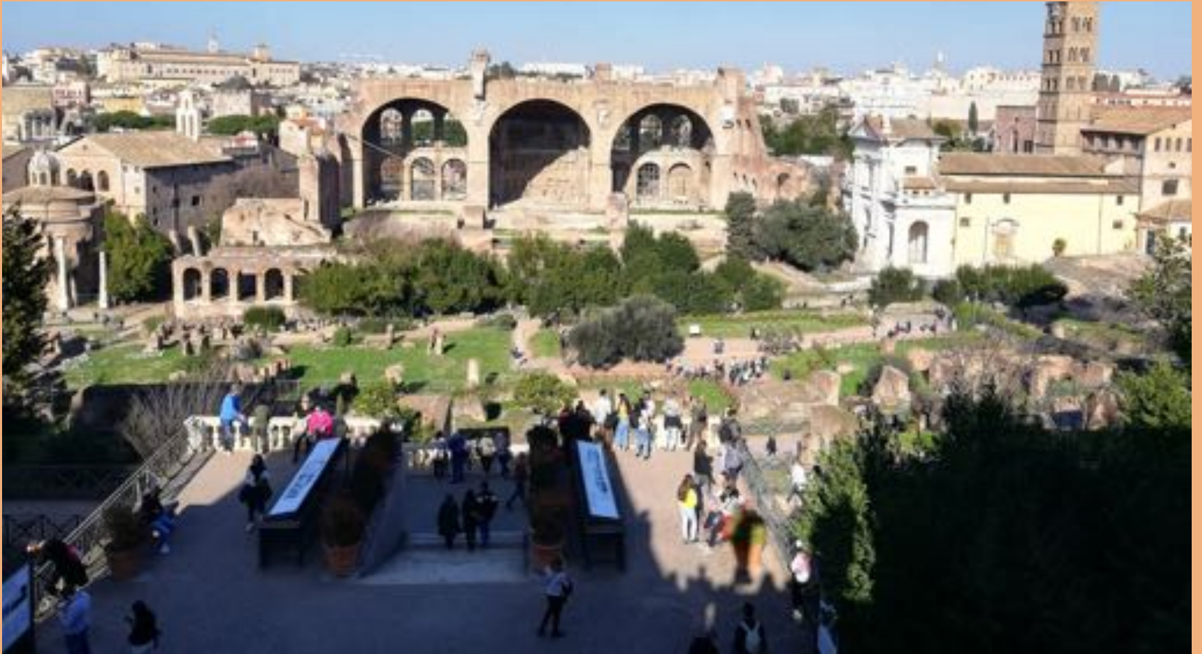
A római Forum Romanum romjai