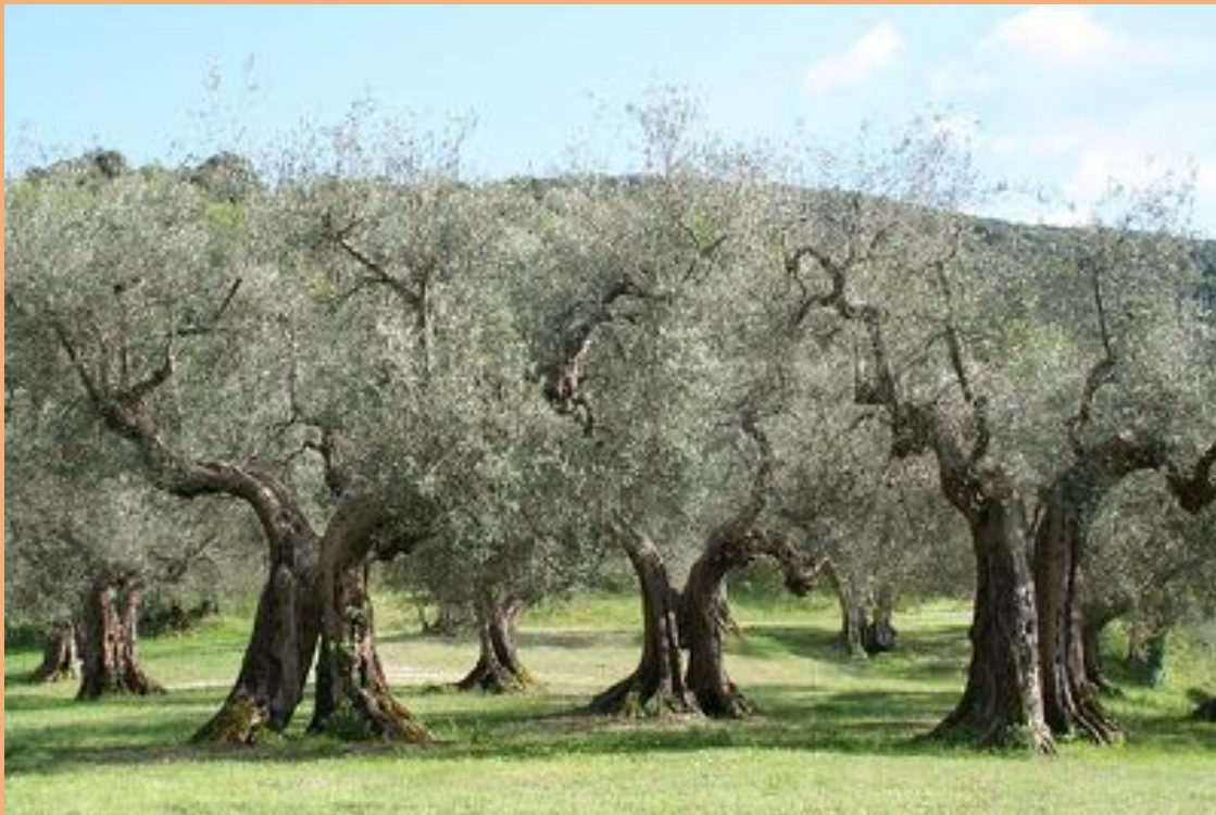
Olajfaligetek – az olívaolaj jótékony hatású

http://emf-krvon.blogspot.com/2013/08/a-mediterran-oshonos-faia-az-oliva.html