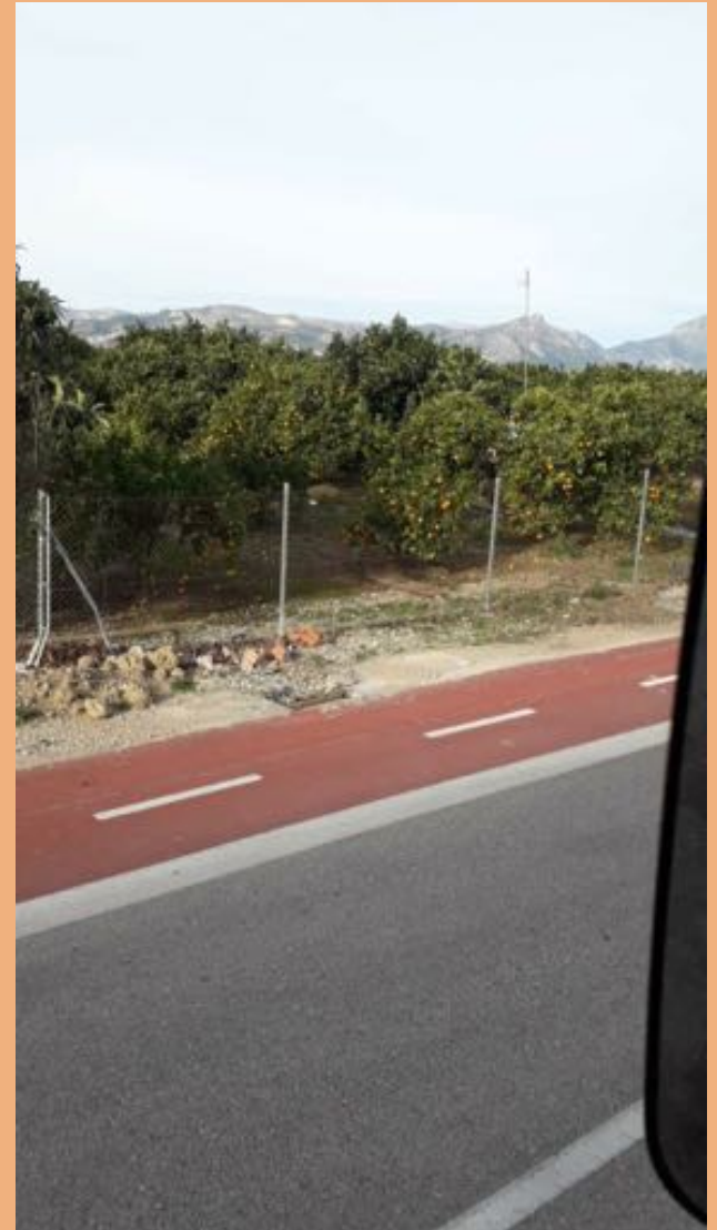
Narancsfák az autópálya mentén Spanyolországban Apukám fotózta

http://emf-krvon.blogspot.com/2013/08/a-mediterran-oshonos-faia-az-oliva.html