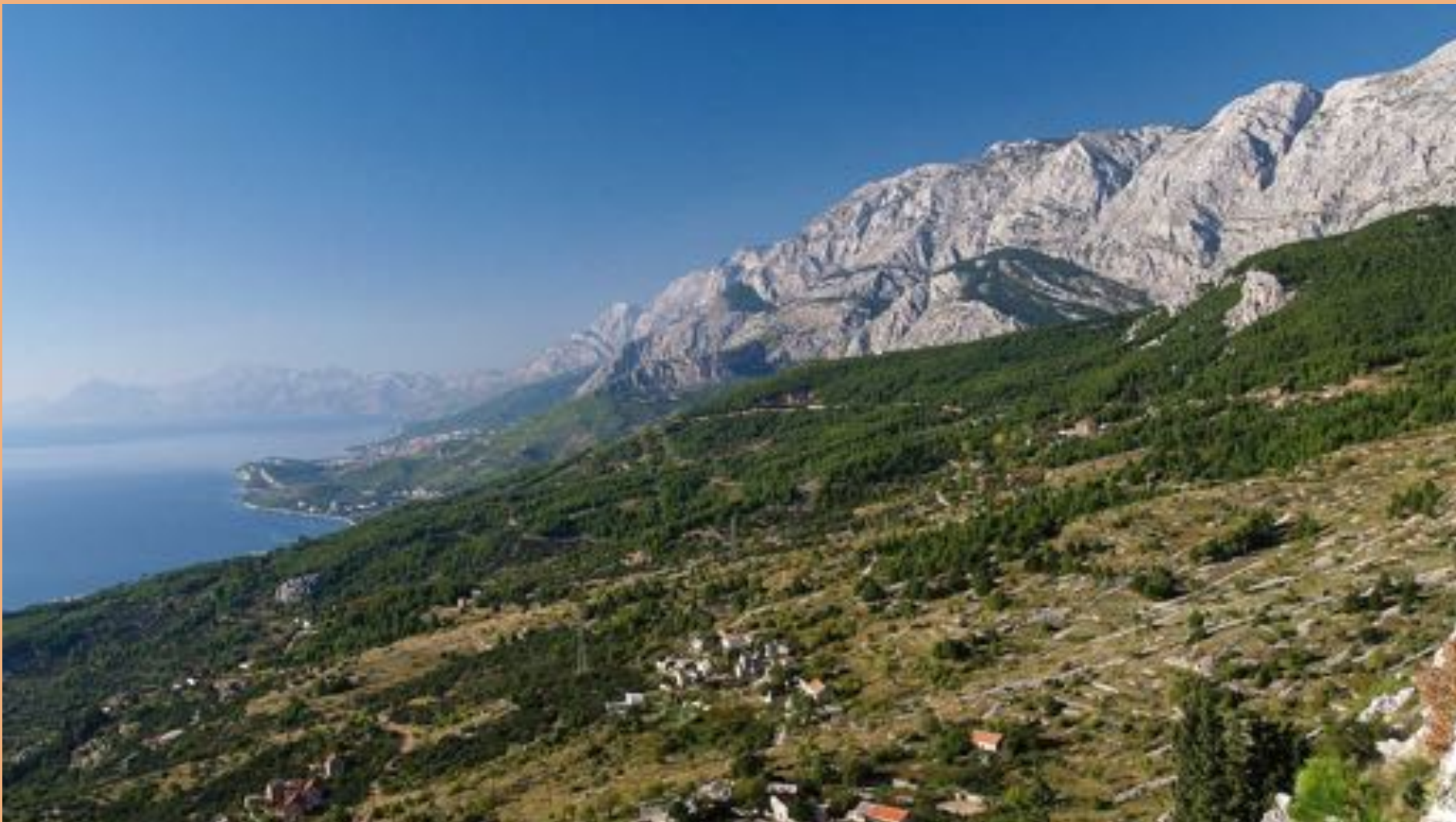
A Biokovo-hegység a Dinári-hegység része A hegy fehér színe a mészkőfelépítésre utal https://croatia.hr/hu-HU/elmenvek/aktiv-pihenes/seta-es-hegymaszas/a-biokovo-hegy