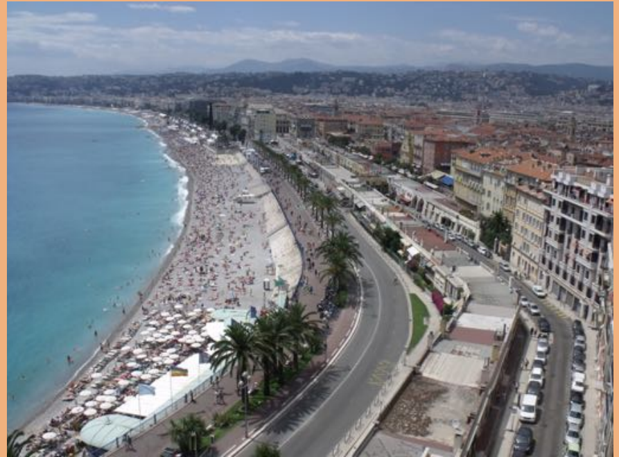
Tengerpart Nizzában rengeteg fürdőzővel