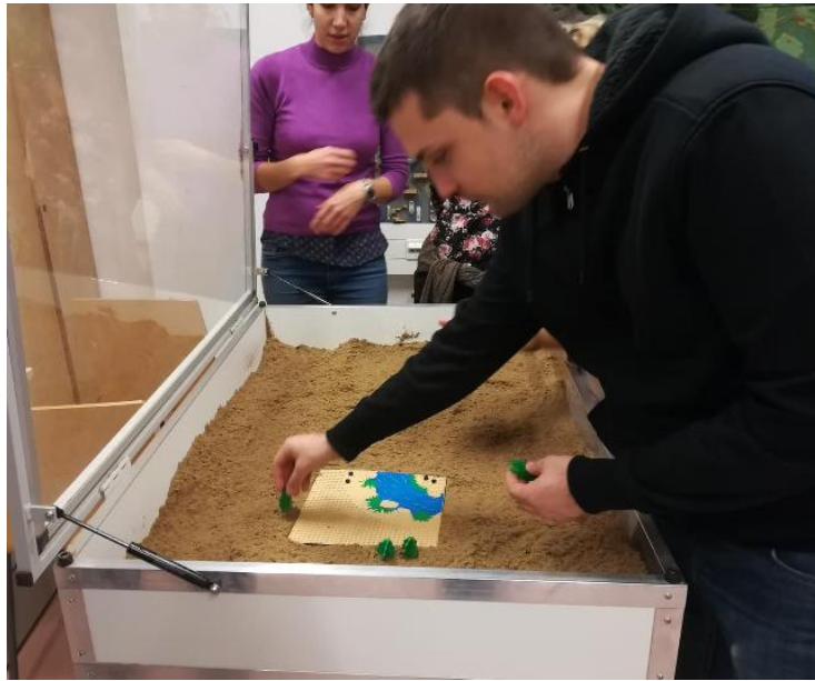
A természeti ipartelepítő tényezők elhelyezése a terepasztalon