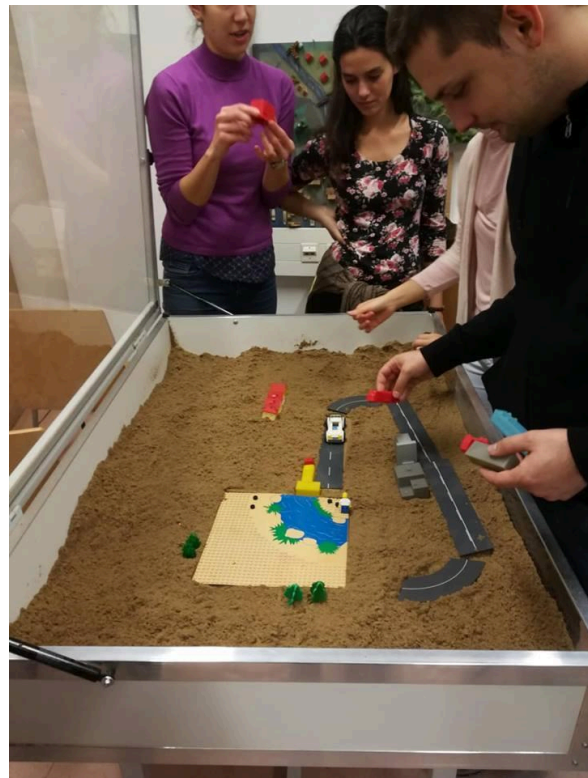
A település, a munkaerő, az ipartelep elhelyezése