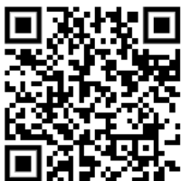
Olaszország világörökségi helyszínei