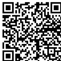
Segítő kép a 2. kérdéshez