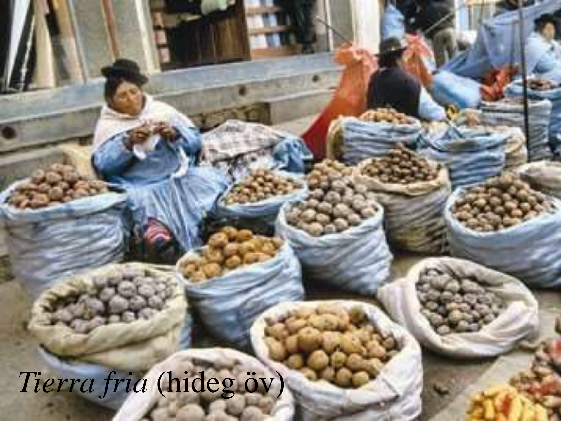
Tierra fria (hideg öv)